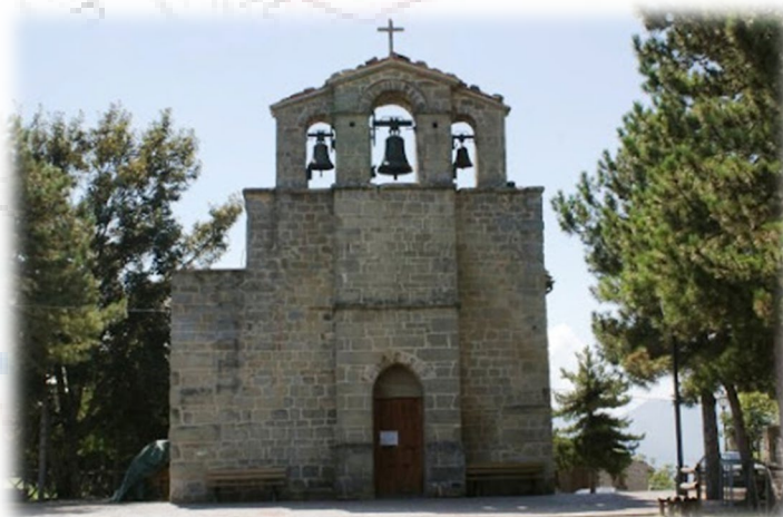
La chiesa di San Giorgio

Ci si tiene sul margine ovest della piana fino a rintracciare il sentierino che scende, aggira Colle Arduccio, fino a precipitare a Poggio Umbricchio.