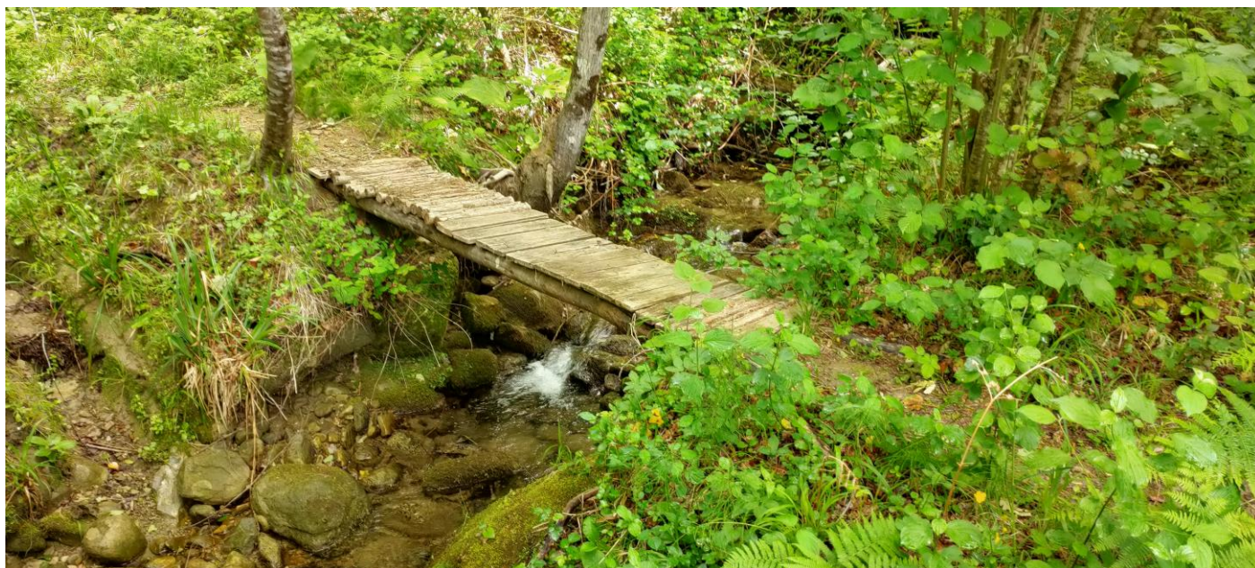
Ponticello sul Fosso di Piandello

Escursione da Valle Fusella a Piandello lungo il Fosso dei Mottari (Monte Ceresa)