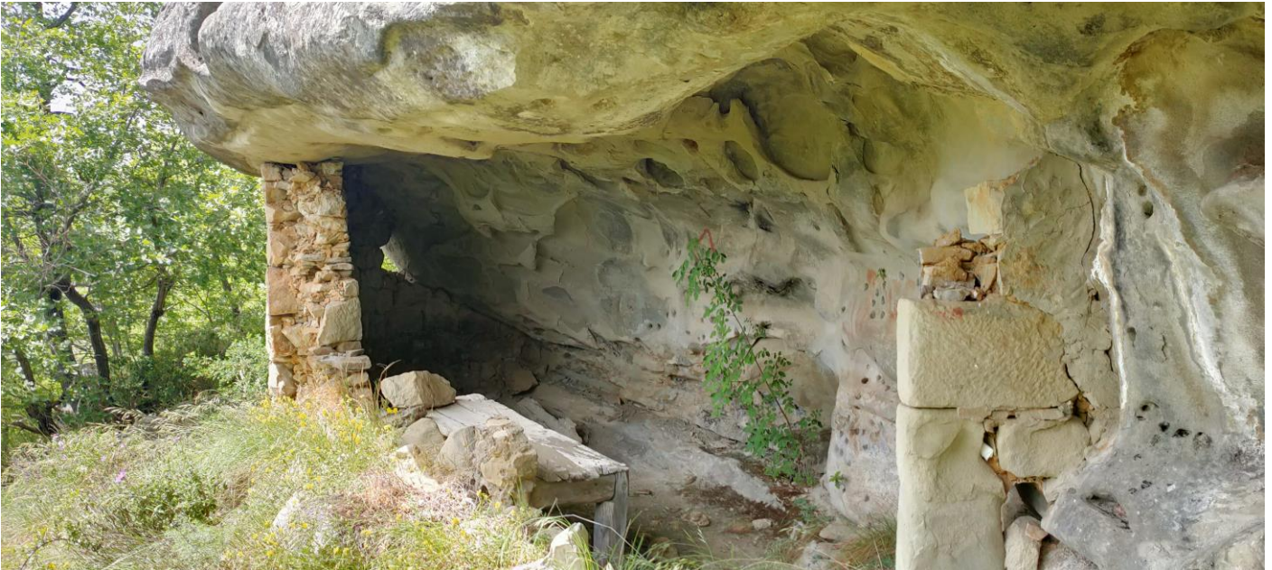
Case incastonate nella roccia

Il percorso presenta degli scorci naturalistici interessanti e tipologie costruttive particolare interesse. E' possibile osservare case incastonate nella roccia (esempio tipico di costruzioni rupestri), boschi misti (castagneti e lecciti) e banchi di arenaria. La morfologia del percorso é piuttosto vario, dal fondovalle al crinale e l'itinerario è adatto a tutti gli escursionisti. Il percorso si rivela ancora più interessante nel periodo primaverile estivo, per la presenza di cascate in prossimità di Case Casale, la cui portata è legata al ciclo stagionale. Molto suggestivi sono i colori e i profumi delle specie floristiche. Questo sentiero era l'antica via di collegamento fra Piandello e il fondovalle. Molto interessante sono le costruzioni a ridosso della cascata dopo Case Casale. Questo tipo di abitazione, senza tetto perché a ridosso di grandi cavità nella roccia, si trovano in altre località del gruppo come nella grotta del Petrieno e a Sasso Miglio.