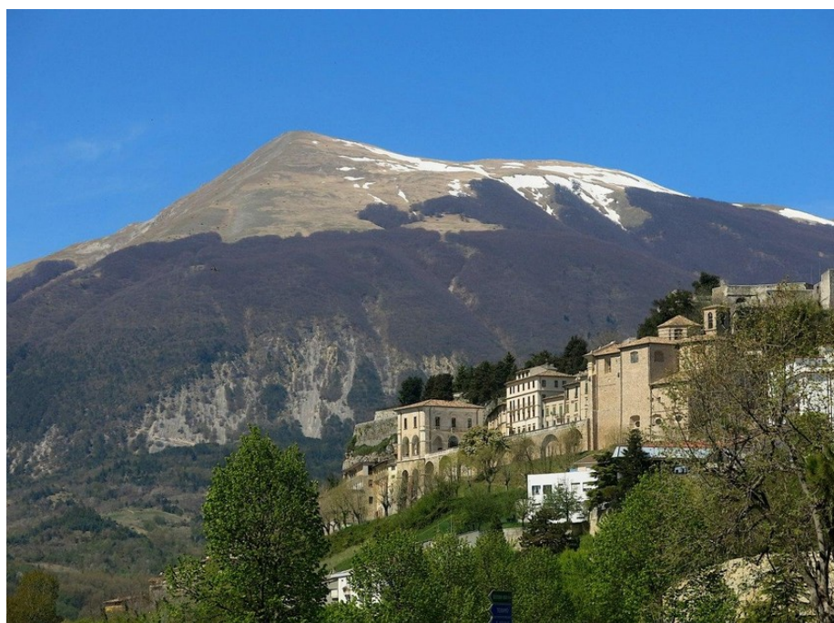
Civitella: L'abitato col Monte Girella sullo sfondo.